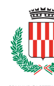
COMUNE DI SETTIMO M.SE