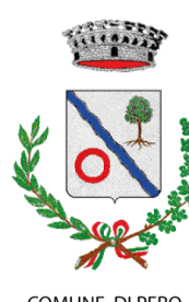
COMUNE DI PERO