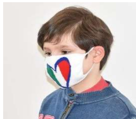
modello esemplificativo della tipologia di mascherina che sarà fornita

MASCHERINE: in caso del permanere della prescrizione di utilizzo di mascherine nel periodo in cui si svolgerà il servizio, in ogni sede saranno fornite in cotone, lavabili e riutilizzabili sia al personale che ai minori iscritti un numero di mascherine sufficienti. Si prevede la fornitura di almeno 2 mascherine lavabili per ogni utente e operatore. Le mascherine saranno fornite da ditta specializzata, realizzate in cotone lavabile, in tre strati, anallergiche, comode da indossare, che favoriscano una fluida respirazione. In caso di necessità la fornitura sarà aumentata.