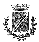
COMUNE DI BAREGGIO