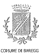
COMUNE DI BAREGGIO