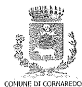
COMUNE DI CORNAREDO

Riferimenti Ufficio: ☎ 02.93263209/256243/250 mail: cuc.arcobase@comune.cornaredo.mi.it PEC: cuc.arcobase@pec.comune.cornaredo.mi.it