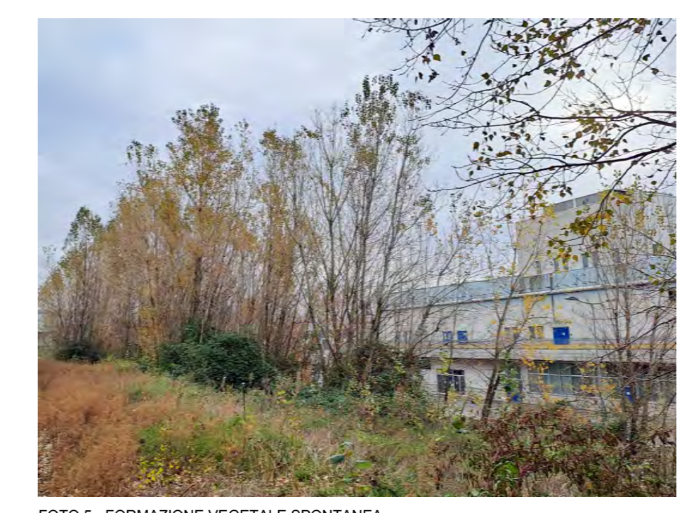
FOTO 5 - FORMAZIONE VEGETALE SPONTANEA