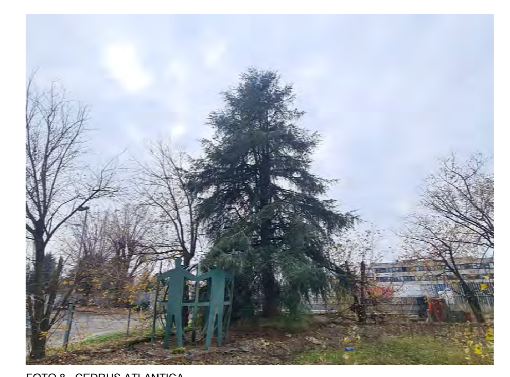
FOTO 8 - CEDRUS ATLANTICA