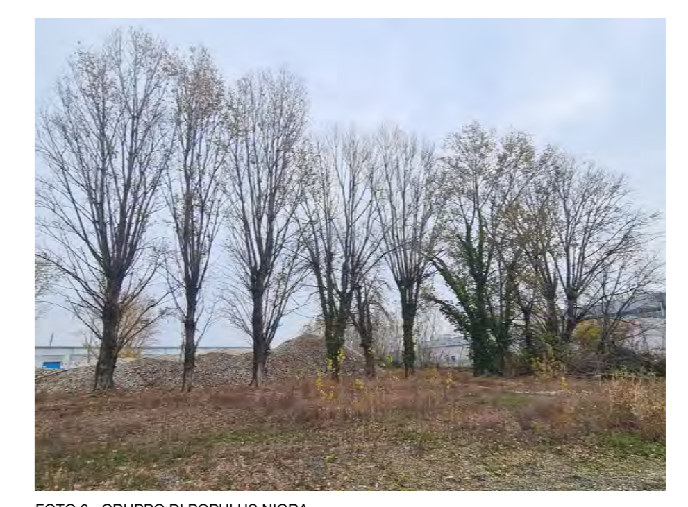
FOTO 6 - GRUPPO DI POPULUS NIGRA