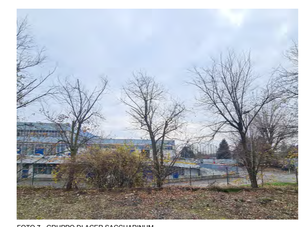
FOTO 7 - GRUPPO DI ACER SACCHARINUM