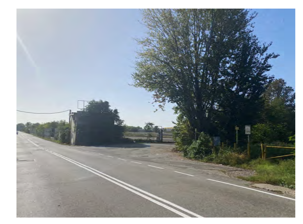
FOTO 1 - INGRESSO NORD VIA MERENDI - POPULUS NIGRA