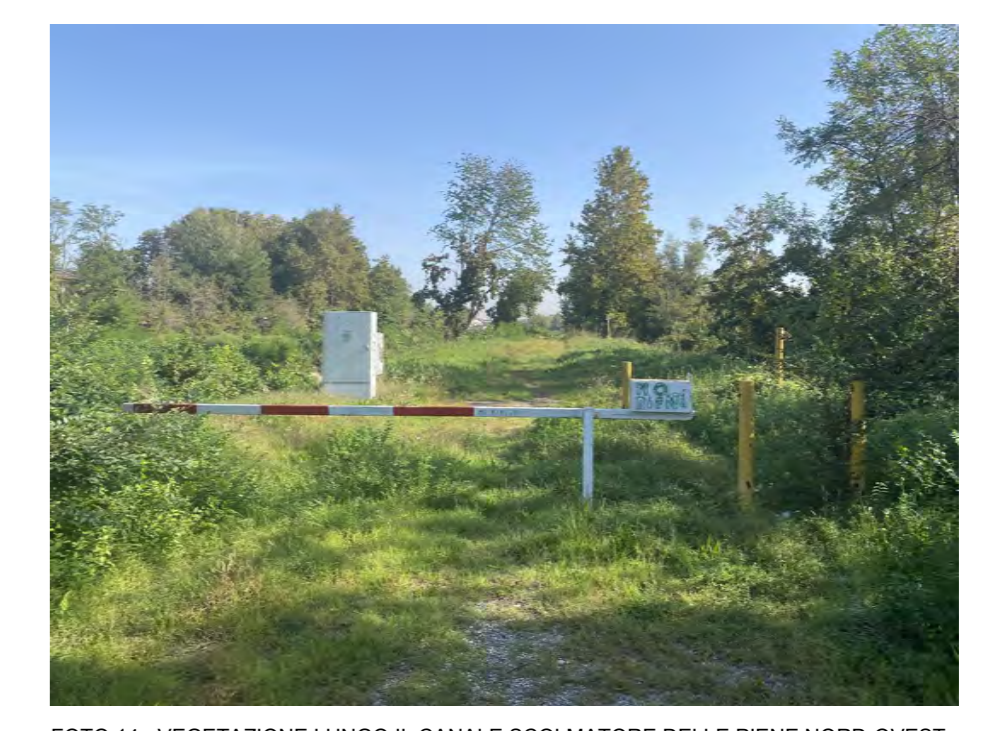
FOTO 14 - VEGETAZIONE LUNGO IL CANALE SCOLLATORE DELLE PENE NORD-OVEST

NOTE 1. LE PARTICELLE RAFFIGURATE CORRESPONDONO ALLE MAPPE CATASTALI LA DIFFERENZA RISPETTO AL RILIEVO TOPOGRAFICO EFFETTUATO RIENTRA NEL 5% DI TOLLERANZA CATASTRALE COME INDICATO NELLA CIRCOLARE DEL MINISTERO DELLE FINANZE N.5 DEL 10 NOVEMBRE 1995 PER COERENZA TRA LA DOCUMENTAZIONE DEL PIANO ATTUATIVO E GLI ATTI DEL CATASTO I PROPRIETARI PROCEDERANNO AD UNA RETTIFICA DELLE SUPERFICIE DICHIARATE. 2. PER L'INDICAZIONE DELLE ESSENZE E DELLE CARATTERISTICHE DI CIASCUN ELEMENTO ARBOREO PRESENTE NEL SITO SI RIMANDA ALL'ELABORATO SCHEDE RILIEVO ARBOREO (COD. DA1-T15)