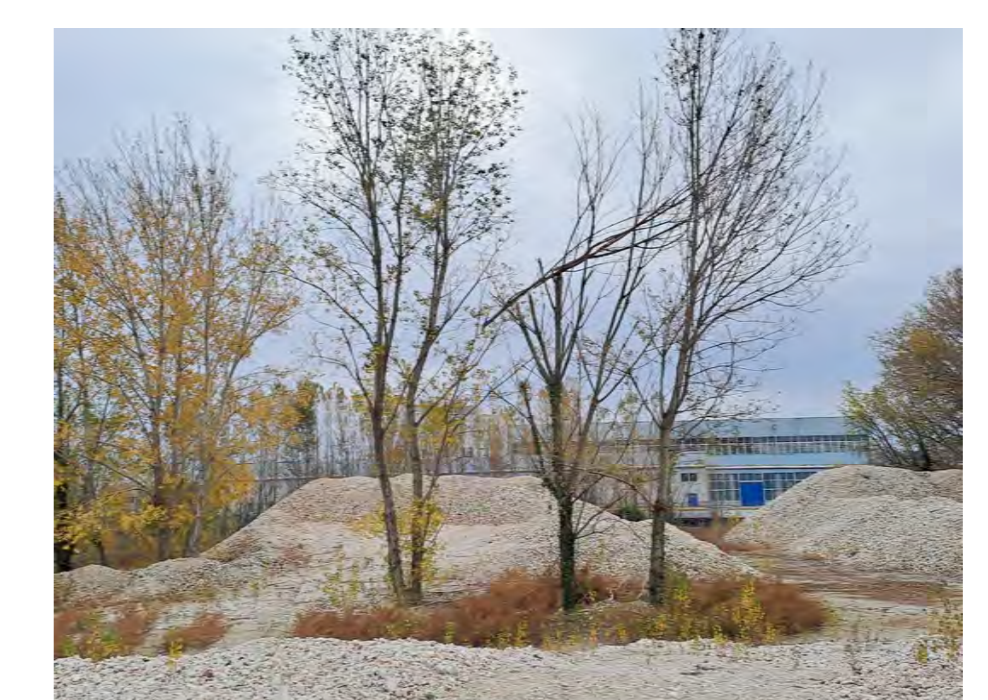
FOTO 3 - GRUPPO DI POPULUS NIGRA