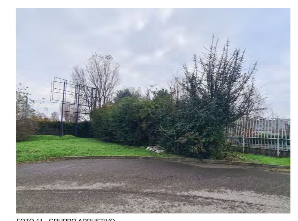
FOTO 11 - GRUPPO ARBUSTIVO