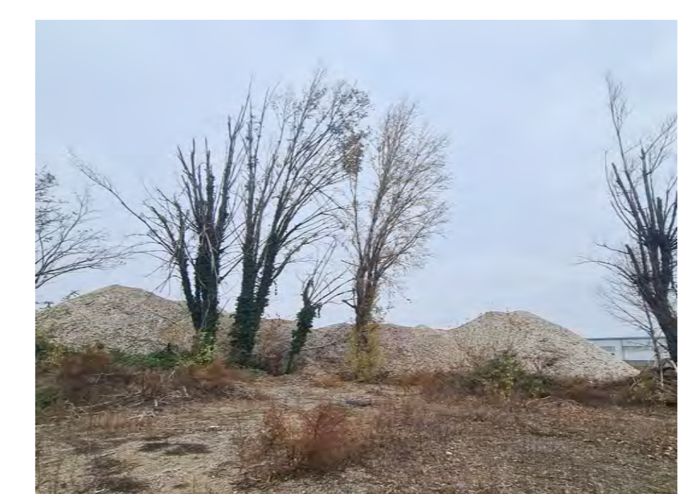
FOTO 4 - GRUPPO DI POPULUS NIGRA