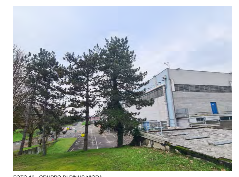
FOTO 13 - GRUPPO DI PINUS NIGRA