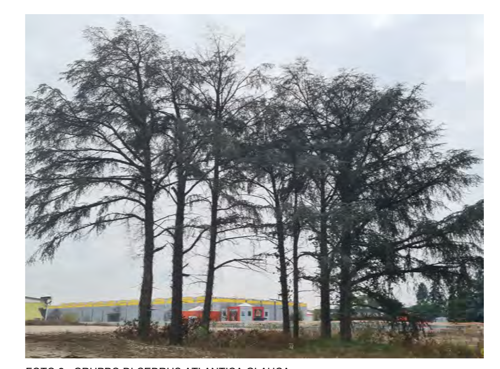
FOTO 2 - GRUPPO DI CEDRUS ATLANTICA GLAUCA