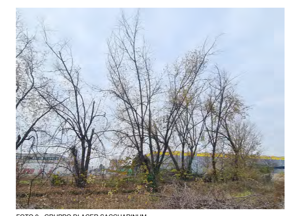
FOTO 9 - GRUPPO DI ACER SACCHARINUM