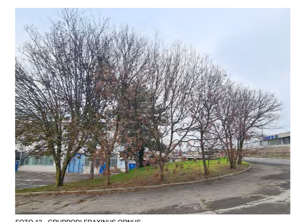
FOTO 12 - GRUPPO DI FRAXINUS ORNUS