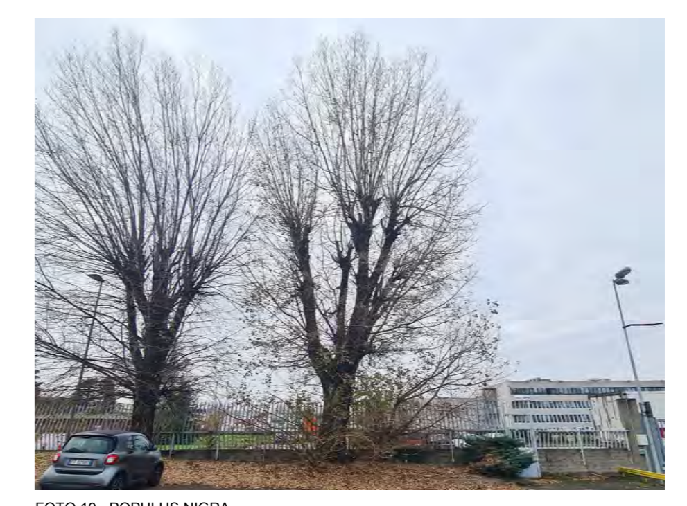
FOTO 10 - POPULUS NIGRA