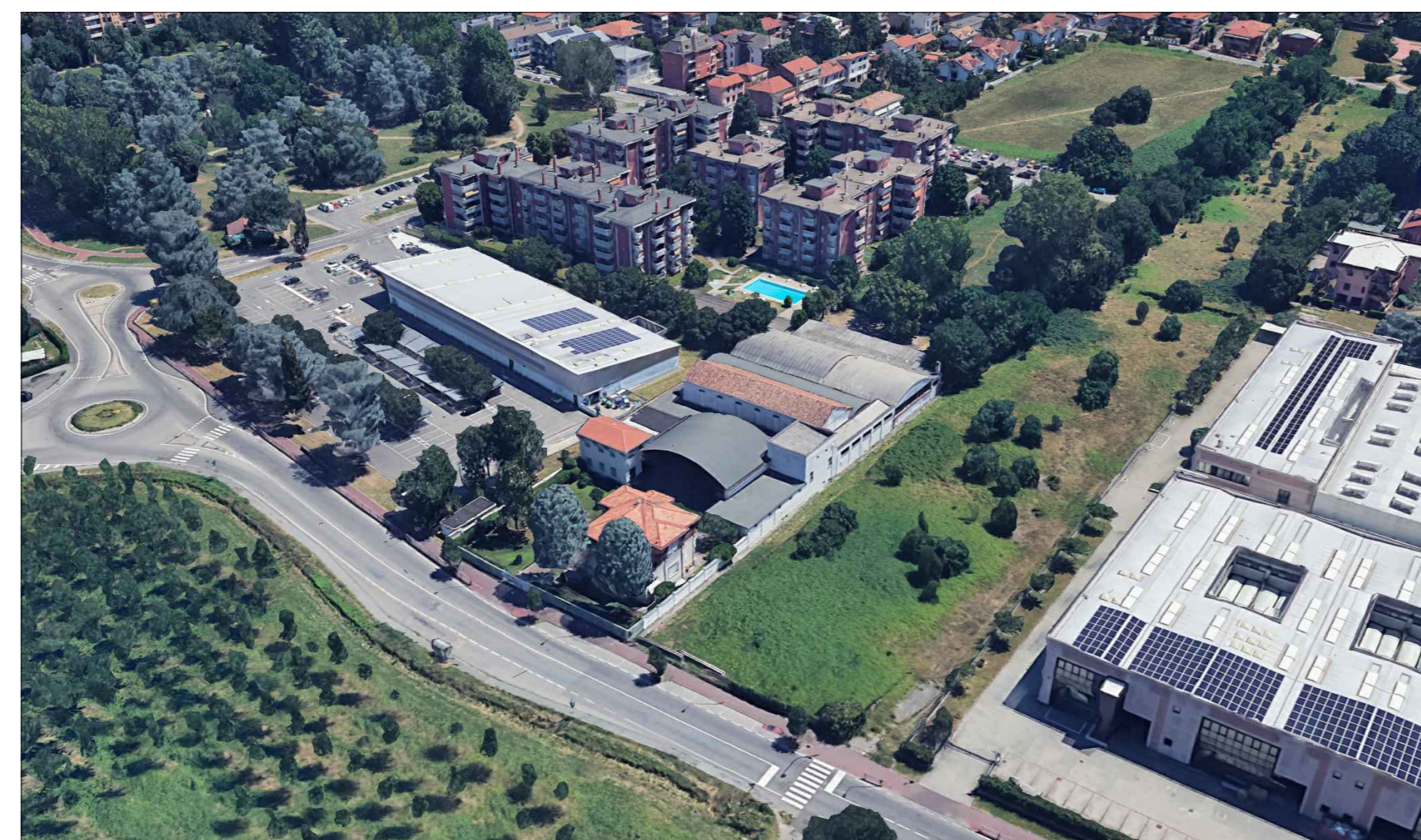
Vista aerea da Nord-Ovest - STATO DI FATTO