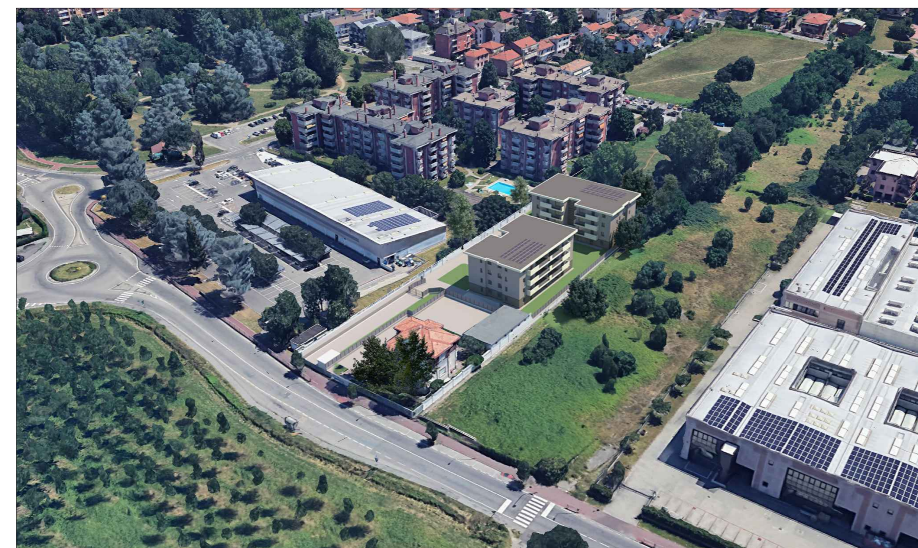
Vista aerea da Nord-Ovest - PROGETTO