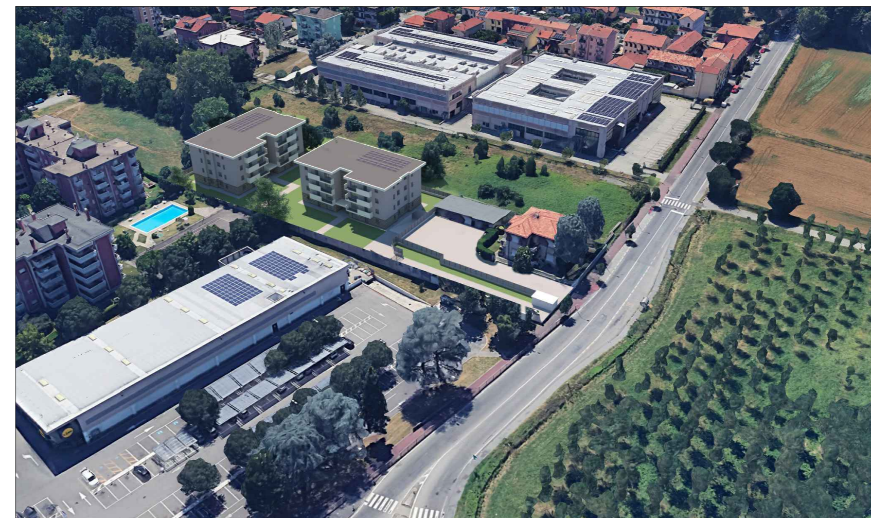
Vista aerea da Nord-Est - PROGETTO