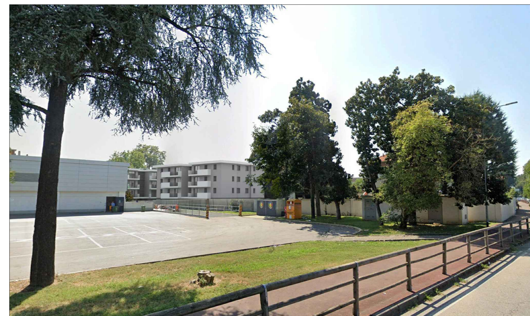
Vista da Nord-Est piano strada - PROGETTO

Località: Comune di Cornaredo (Città Metropolitana di Milano)