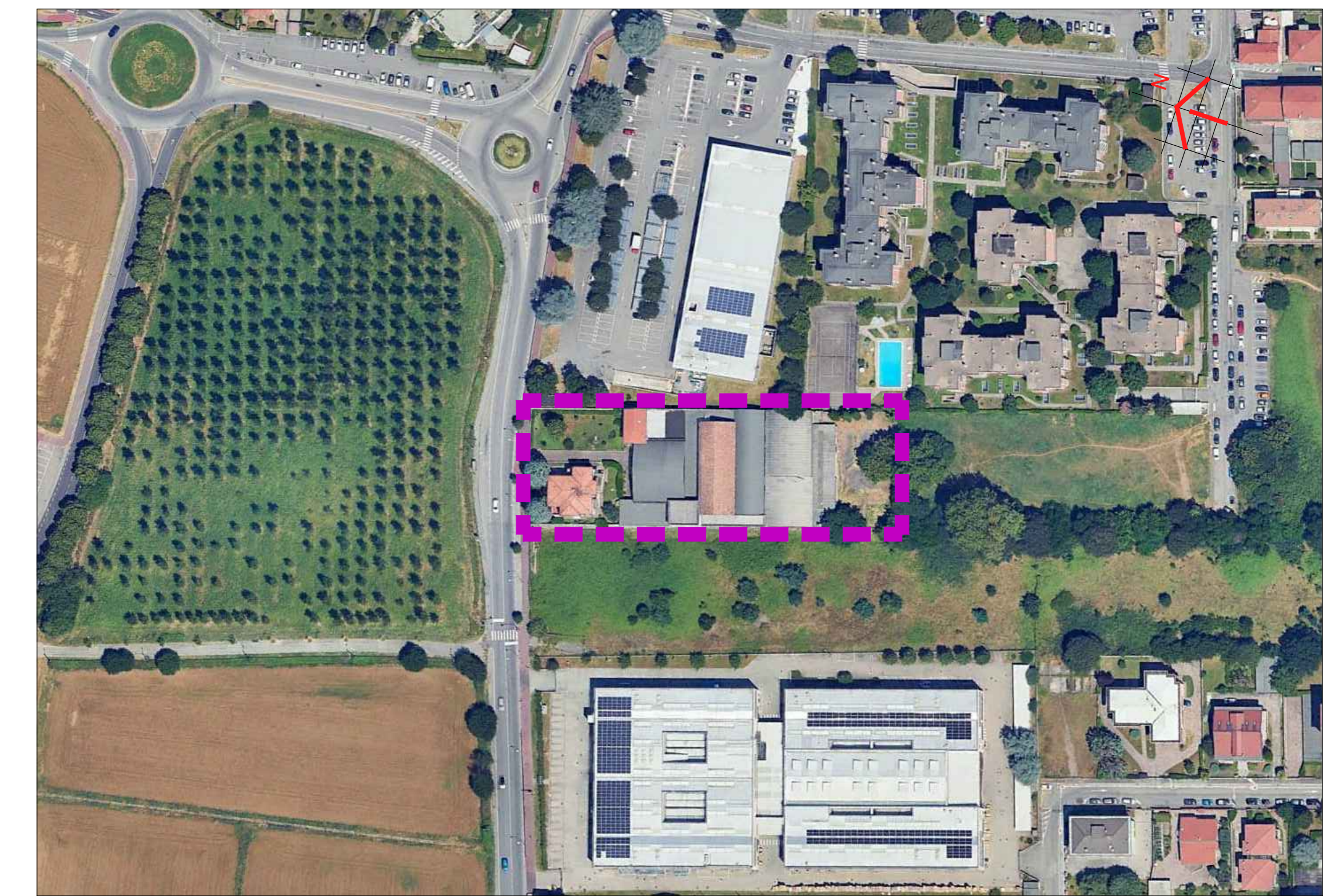
Immagine satellitare dell'area - STATO DI FATTO