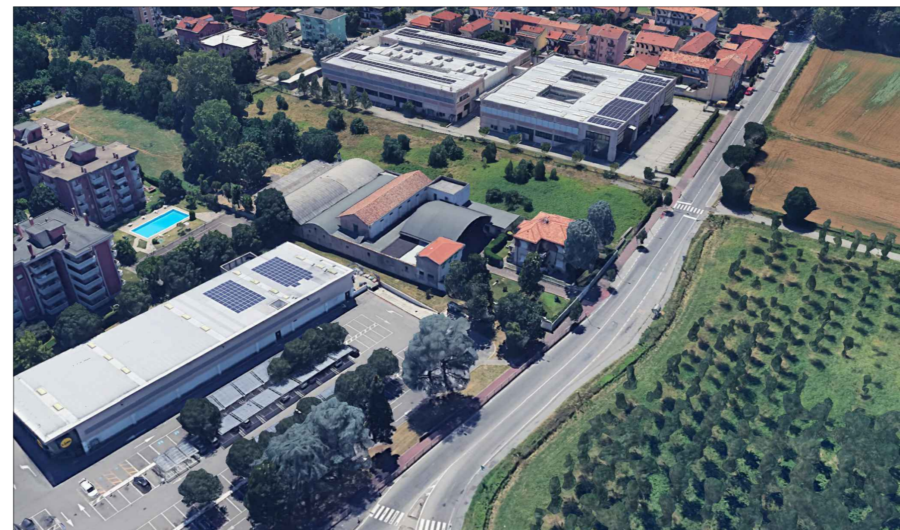
Vista aerea da Nord-Est - STATO DI FATTO